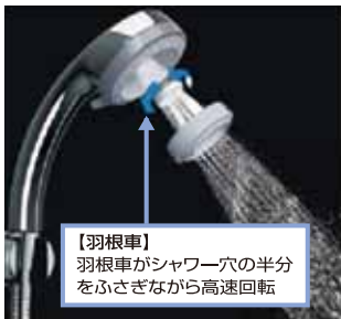
【羽根車】 羽根車がシャワー穴の半分をふさぎながら高速回転